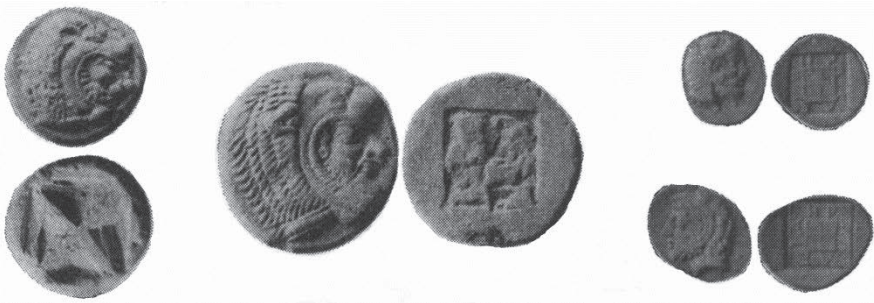
Αρχαία ασημένια νομίσματα της πόλεως Ηράκλειας

Οι ιστορικοί ερευνητές διαφωνούν στις απόψεις των περί της θέσεως της Ηράκλειας λόγω ελλείψεως ιστορικών στοιχείων. Την τοποθετούν σε οκτώ θέσεις, από τη Βισαλτία μέχρι το Μελένικο, ήτοι: α) στο Ζερβοχώρι, β) στον Λιθότοπο, γ) στα νότια της Πρασιάδας λίμνης, δ) στη σημερινή Ηράκλεια, ε) στο Σιδηρόκαστρο, στ) βορείως του Σιδηροκάστρου, ζ) στο Νέο Πετρίτσι, η) στο Μελένικο. Για να δικαιολογήσουν τις διάφορες θέσεις της εισηγούνται δύο Ηράκλειες, μία στη Βισαλτία και μία άλλη στη Σιντική.