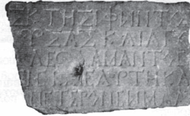
Τάφος, κτερίσματα και επιτύμβια στήλη από το ρωμαϊκό νεκροταφείο

είχε κάτω διαπιστώθηκε ότι ήταν στοά υδραγωγείου. Δεξιότερα αποκαλύφθηκαν κατεστραμμένοι καμαροσκεπείς τάφοι διαφόρων μεγεθών. Δέκα περίπου μέτρα δεξιότερα, προς το μέρος του παλαιού διδακτηρίου, σε βάθος τριών μέτρων, κάτω από το οίκημα που γκρεμίστηκε, αποκαλύφθηκε ένα πολύ στερεό κτίσμα σε σχήμα καμάρας. Ο χειριστής του μεγάλου εκσκαφέα προσπαθούσε να το γκρεμίσει. Ευτυχώς βρέθηκα εκείνη τη στιγμή εκεί, διότι είχαμε διάλειμμα. Διέκοψα τις εργασίες, ειδοποίησα την Εφορεία Κλασικών Αρχαιοτήτων Καβάλας και την τοπική διοίκηση Χωροφυλακής. Στη νότια πλευρά κατά μήκος του άξονα της καμάρας αποκαλύφθηκε κλεισμένη η είσοδος με μία μαρμάρινη πλάκα. Την άνοιξα και μπήκα μέσα. Από τα οστά που αντίκρισα σχημάτισα αμέσως τη γνώμη ότι επρόκειτο περί τάφου.