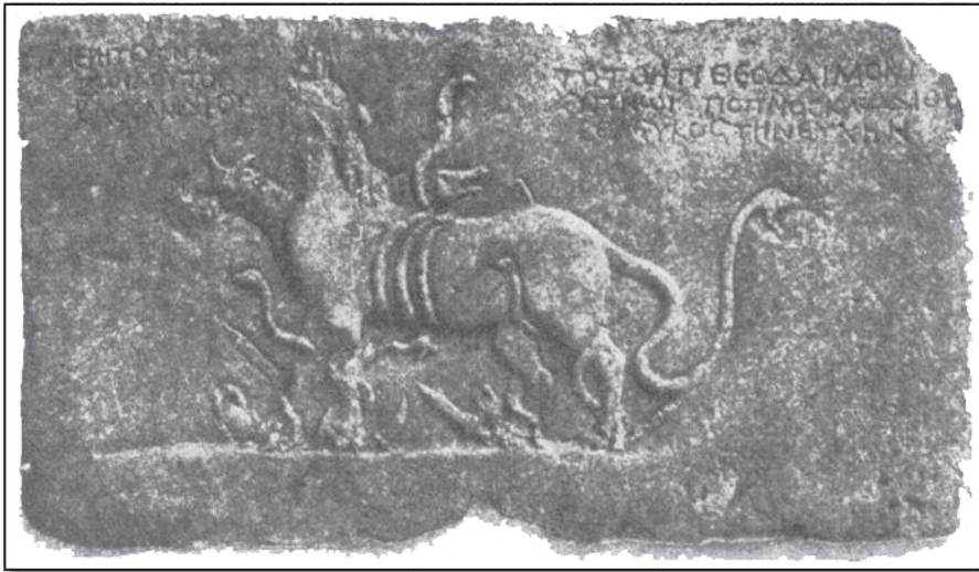
Μαρμάρινο ανάγλυφο με τον Θεοδαίμονα

Ήταν καταχθόνιος θεός, όπως ο Ερμής. Στην πολιτεία του Πλάτωνα (Α.392) περιγράφεται ως θεός του Άδη («Θεών δαιμόνων των εν Άδη»).