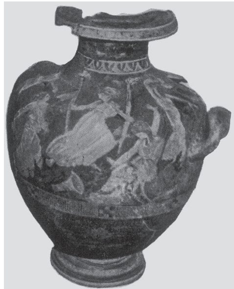
Μαινάδες σε βισαλτικό κρατήρα (Ζερβοχώρι)

Όλα είναι υποθέσεις. Μόνο η αρχαιολογική σκαπάνη της νεοϊδρυθείσης 28 ης Εφορείας Κλασικών Αρχαιοτήτων το 2004 με έδρα την πόλη των Σερρών ή κάποιας ξένης αρχαιολογικής εταιρείας θα ρίξει φως στον εντοπισμό των θέσεων των πόλεων της Βισαλτίας.