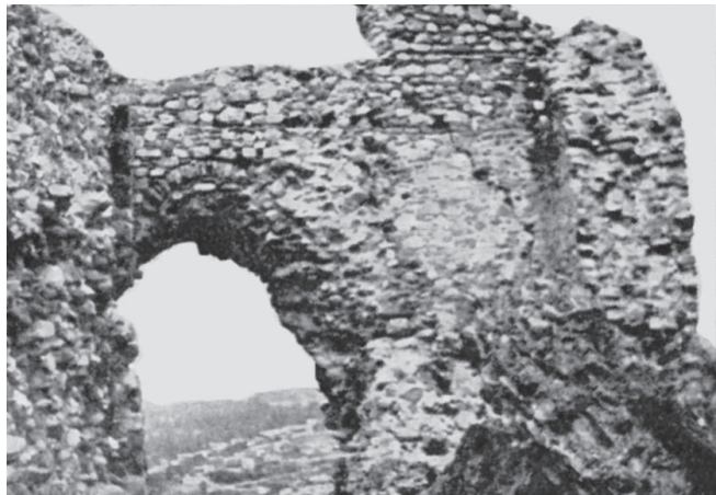
Τείχη της αρχαίας Σιντικής

Στη θέση του Νέου Πετριτίου, ως χώρου όπου βρισκόταν η αρχαία Ηράκλεια, κατέληξε και ο αείμνηστος Γ. Καφταντζής 282 διότι η θέση αυτή συγκεντρώνει πολλά προνόμια. Είναι ασφαλής τοποθεσία, σε αξιόλογη γεωγραφική, στρατιωτική και συγκοινωνιακή θέση, ανάμεσα σε βουνό και βάλτο δίπλα από τον ποταμό