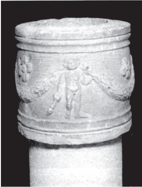
Τεφροδοχείο με ανάγλυφη διακόσμηση

Από τις αρχές του 20 ου αιώνα βρισκόταν μία επιτύμβια στήλη στη γωνία της αυλής του παλαιού νοσοκομείου, του νυν 3ου γυμνασίου Σερρών. Το 1970, ως έκτακτος επιμελητής αρχαιοτήτων του νομού Σερρών, διορισμένος από το υπουργείο, ανέλαβα να συγκεντρώσω στο νεοσυσταθέν Αρχαιολογικό Μουσείο της πόλης τα διασκορπισμένα στο νομό Σερρών αρχαιολογικά ευρήματα. Μεταξύ αυτών μετέφερα ο ίδιος με φορητό αυτοκίνητο την παραπάνω στήλη στην είσοδο του Μουσείου. Έχει ύψος 1,50 μ. με ανισομερή πάχος και πλάτος. Εικονίζονται ανάγλυφα μέσα σε έγκοιλο τετράγωνο της στήλης ο Διοσκουρίδης και η Στρατονίκη, οι οποίοι ενώ ζούσαν ακόμη έστησαν την επιτύμβια στήλη εις μνήμην της