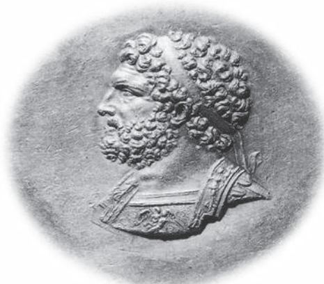
Κεφαλή του Φιλίππου Β΄

Μετά από τον Αλέξανδρο Α΄ στο θρόνο της Μακεδονίας ανέβηκε ο γιος του Περδίκκας Β΄ (448 π.Χ.) και βασίλεψε 40 χρόνια. Ήταν δραστήριος με πολλές στρατιωτικές και πολιτικές ικανότητες. Το 417 π.Χ. συγκρούστηκε με τους Αθηναίους αλλά συμφιλιώθηκε αμέσως και υποστήριξε το στρατηγό Ευαίνετο στην επίθεση κατά της Αμφιπόλεως το 414 π.Χ.