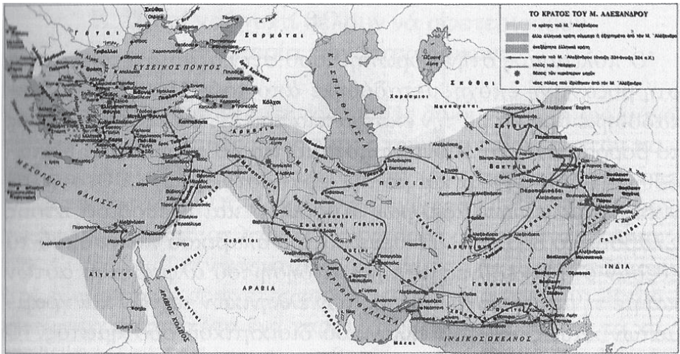
Χάρτης του κράτους του Μ. Αλεξάνδρου και των εκστρατειών του

Ο Μ. Αλέξανδρος ξεκίνησε την εκπολιτιστική εκστρατεία του ως στρατη-